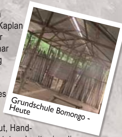
Grundschule Bomongo - Heute